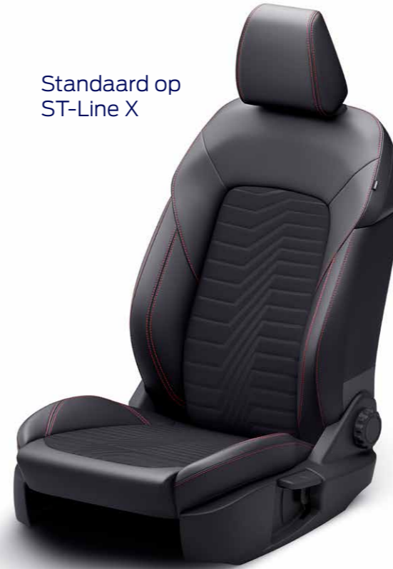
Standaard op ST-Line X