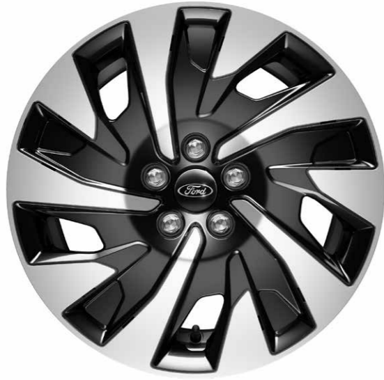
17 inch Designer velgen met 8-spaaks sierdeksel