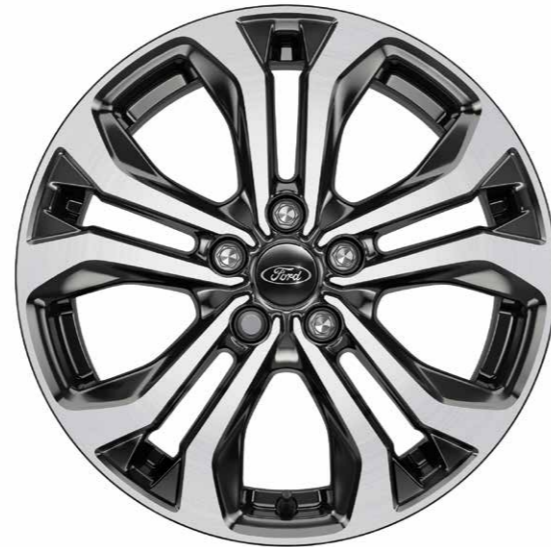
17 inch 10-spaaks lichtmetalen velgen in Black Machined