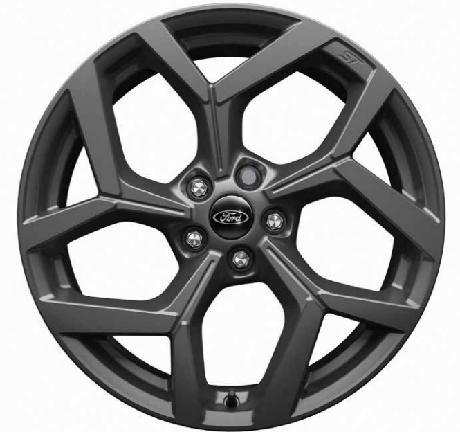
19 inch lichtmetalen velgen in Magnetite