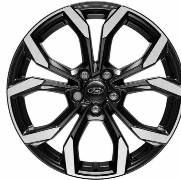
18 inch 5-spaaks lichtmetalen velgen in Absolute Black high gloss Machined