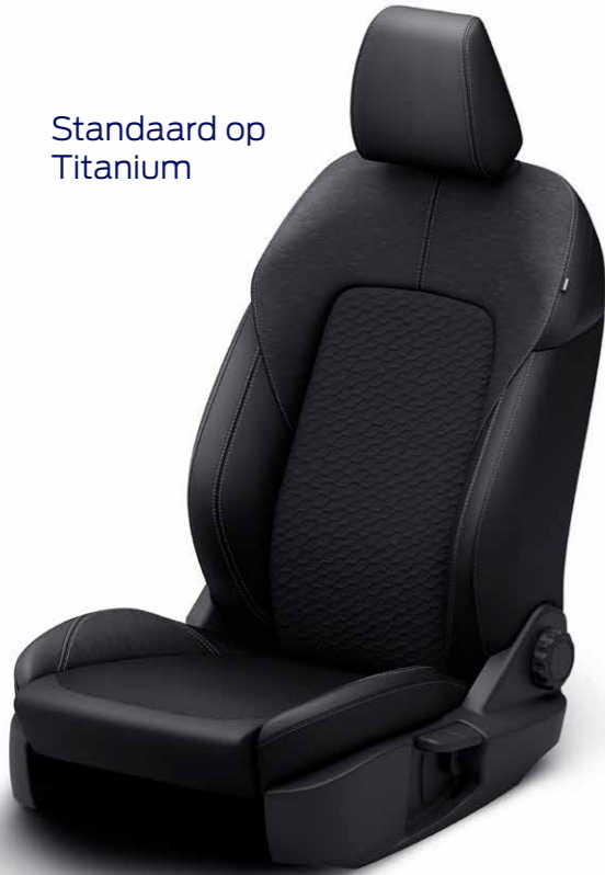
Standaard op Titanium