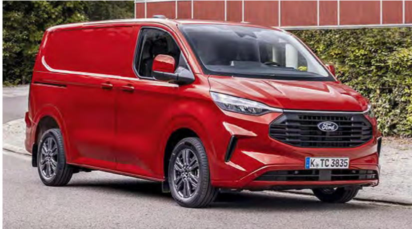
Grille wijkt af van afbeelding