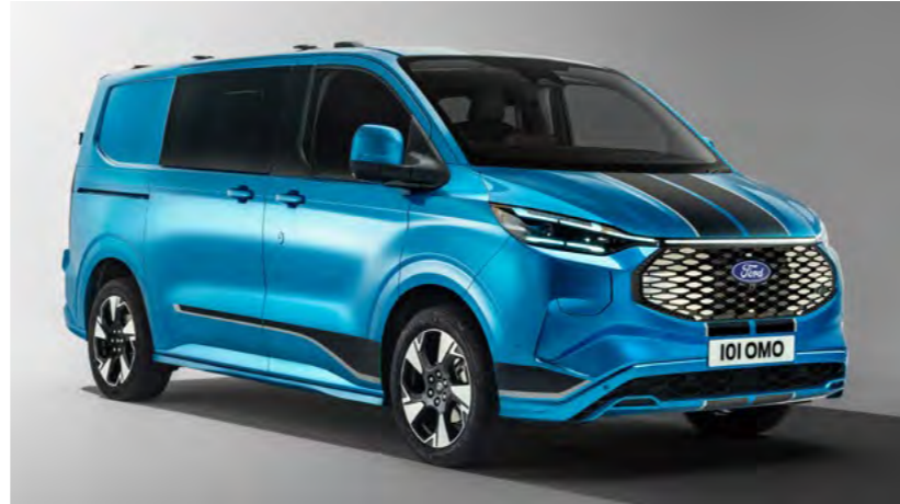
Grille en koplampen wijken af van afbeelding