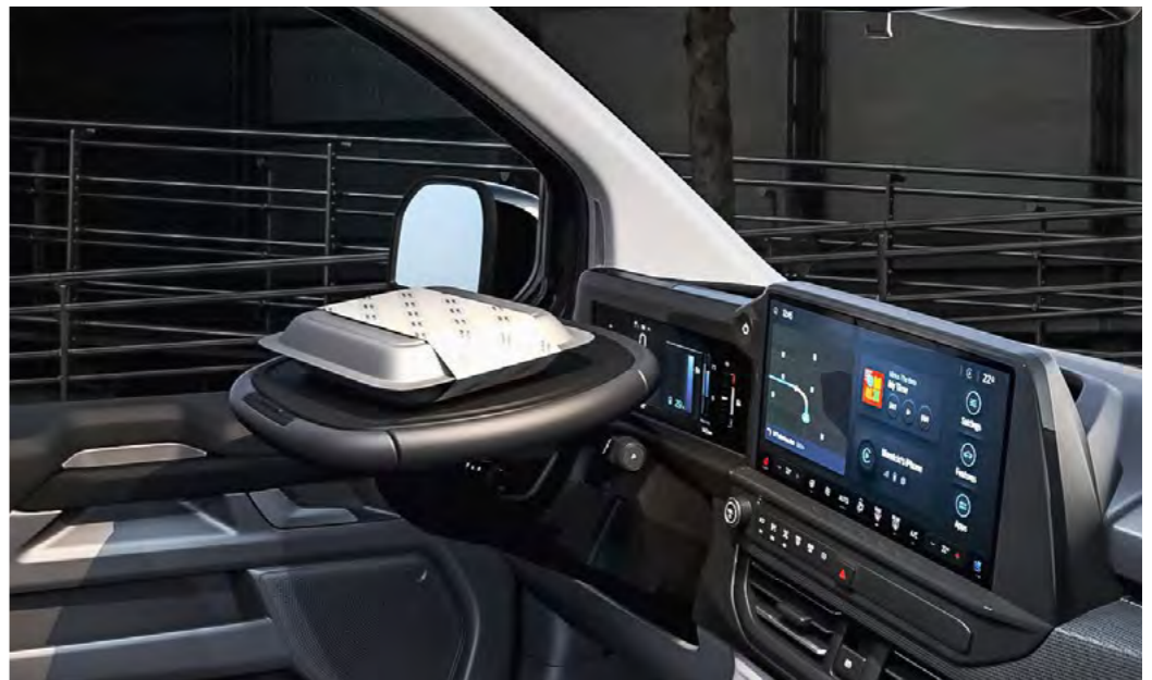
Afgebeeld: Mobile Office Pack